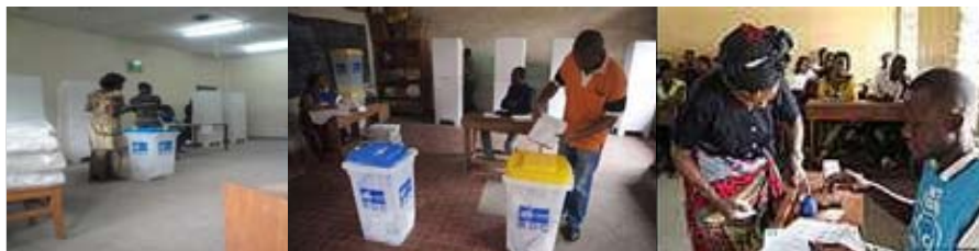
Déroulement des opérations de vote

Chaque bureau de vote, supposé être suffisamment éclairé, est pourvu de tous les matériels électoraux requis (des urnes correspondant au nombre de scrutins, des isolements garantissant le secret du scrutin, des listes électorales, des listes d'émargement, de l'encre, des stylos, ...). Les listes des candidats et leurs photos sont affichées dans chaque bureau de vote de la circonscription électorale où ils se présentent afin de permettre aux électeurs de retrouver facilement leurs candidats.