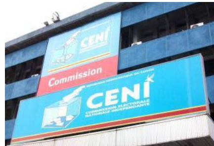
Siège de l'administration électorale en RDC

La CENI en RDC est une institution d'appui à la démocratie créée par la Loi n°10/013 du 28 juillet 2010 sur les vestiges de l'ancienne Commission Electorale Indépendante (CEI) qui était chargée d'organiser les élections en 2006. Son statut juridique présente des traits essentiels ci-après :