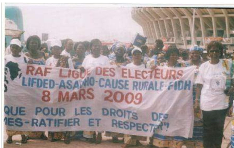
Ci-dessus, célébration de la journée des Femmes par les Défenseuses de Droits de l'Homme sous l'égide de la L.E

Cependant, pour un pays aux dimensions géographiques aussi énormes (2 345 000 km 2 ) comme la RDC et dont les infrastructures routières sont en état de délabrement avancé et les moyens de communication moderne (téléphone) quasi inexistant dans le temps, 18.000 observateurs ne pouvaient couvrir tout le territoire national.