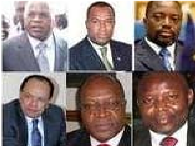
Quelques candidats aux élections présidentielles

La présentation de candidature consiste en la remise, par le parti politique ou le regroupement politique, d'une lettre de dépôt de la liste de ses candidats, et, pour le candidat indépendant, d'une déclaration de candidature par lui-même ou son mandataire, conformément aux modèles fixés par la CENI 19 . La déclaration de candidature est obligatoire. Par ailleurs, la date limite de dépôt et de retrait, d'ajout ou de substitution de candidature est fixée conformément au calendrier établi par la CENI 20 .