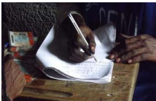
Liste additive dans un centre de vote à Selembao