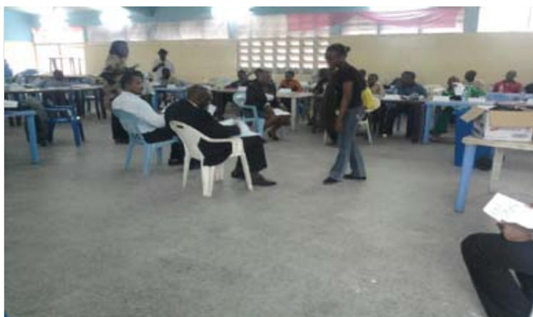
Ci-dessus, la formation des observateurs électoraux de la L.E à Kinshasa/LIMETE