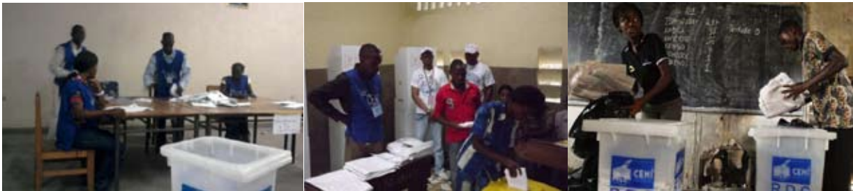
Les opérations de dépouillement dans un bureau de dépouillement

Le président du BV transformé immédiatement en bureau de dépouillement procède à celui-ci selon la procédure 34 suivante : il rompt les scellés de l'urne devant les membres du bureau, les témoins, les observateurs, les journalistes et les cinq électeurs désignés comme témoins des électeurs ayant pris part au vote dans le bureau en question. Il déverse le contenu de l'urne sur une table bien au milieu du bureau de dépouillement. Il prend chaque bulletin, le donne au premier assesseur qui en lit à haute voix le choix et la classe dans un tas selon une méthodologie bien déterminée par les procédures de dépouillement. Pendant qu'il lit à haute voix les votes, l'assesseur suppléant et le deuxième assesseur sont obligés pour leur part à marquer le vote par un trait vertical sur la liste de pointage des résultats. Ce procédé facilite la vérification des votes exprimés commis en cas de discordance entre les chiffres. Une fois le nombre des voix bien établi, le secrétaire aidé par tous les membres du bureau, établit le procès-verbal des opérations de dépouillement et affiche les résultats électoraux à la porte du bureau de vote et de dépouillement. Ainsi, le travail de constitution des plis à acheminer au centre de compilation des résultats peut alors être envisagé. Pour faciliter la constitution des plis, la CENI met à la disposition des bureaux de vote des enveloppes sur lesquelles sont mentionnés les destinataires ainsi que le type de documents précis qui doivent leur être envoyés.