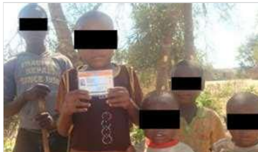
Des mineurs munis de cartes d'électeur

Présence et réactions policières face aux manifestations de l'opposition : tirs sur les manifestants, jets de gaz lacrymogènes, brutalités, arrestations.