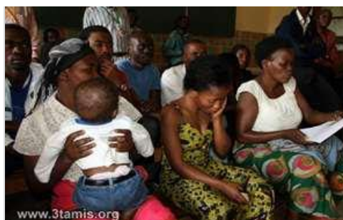
Attente dans un bureau d'enrôlement

7°. Une couverture médiatique du processus trop faible et orientée politiquement: Les médias ont joué un rôle de propagande plutôt que de relais d'informations. Certains médias ont pris des positions politiques claires dès le début et n'ont que rarement ou pas donné la parole à des candidats autres que ceux qu'ils soutenaient.