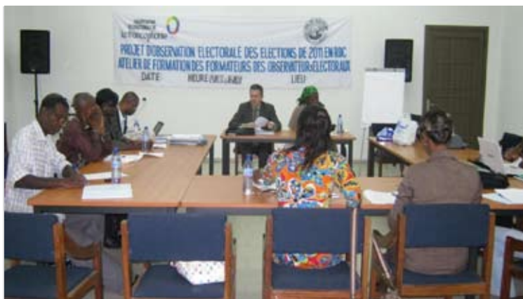
Ci-dessus, la L.E en pleine formation des formateurs des observateurs électoraux au Centre Carter à Kinshasa/Gombe