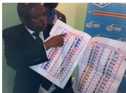
Bulletin de vote

Pour rappel, confirmant la décision de la CENI du 30 septembre 2011, la Cour Suprême œuvrant en tant que Cour Constitutionnelle a jugé 48 dossiers irrecevables. Pour autant, le nombre élevé des candidatures à la députation nationale a entraîné la fabrication pour les circonscriptions de Kinshasa, des bulletins qualifiés à tort ou à raison par certains de « plus gros bulletin de vote » au monde.