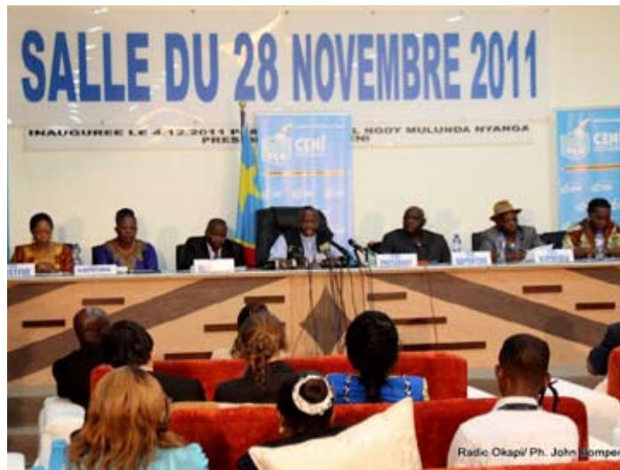
Les membres du Bureau de la CENI tous réunis dans la salle du 28 novembre 2011

Outre le Bureau, la CENI s'appuie, par ailleurs, dans l'exécution de ses tâches, sur d'autres structures opérationnelles suivantes :